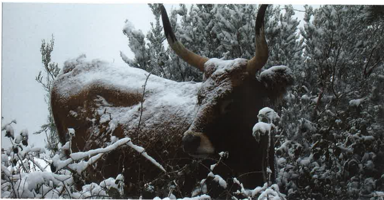
Vaca de raza cachena baixo a neve.

Nalgunha delas non se satisfai, xa que estamos a falar de razas en perigo de extinción, a demanda vai en aumento pero nalgunhas, cabra galega por exemplo, levamos traballando tan só dende o ano 2010, que partindo de case nada temos cerca de 700 cabezas, e as explotacións queren medrar o que dificulta a formación de novas ganderías. Este é un feito pasaxeiro que pensamos que se corraxirá en pouco tempo.