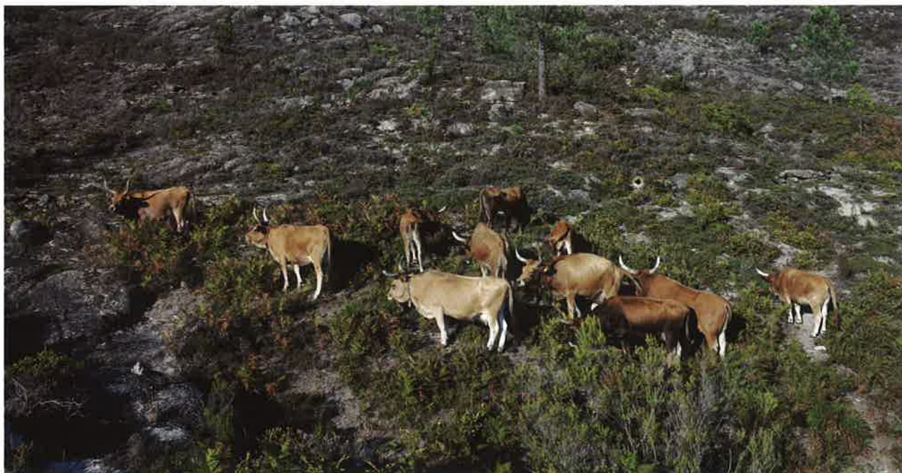
Rabaño de vacas de raza vianesa na montaña da Veiga (Ourense).

canto o que producen é superior ao que gastan, pero en xeral se unha tenreira non produce moitos quilos, ou un cordeiro é pequeno, din que son razas improdutivas ou non produtivas, cousa que co pensamento de cantidade pode ser certo, pero en ganancia económica non o é, e claramente todo isto, enmarcado nun contexto de produción de cantidade.