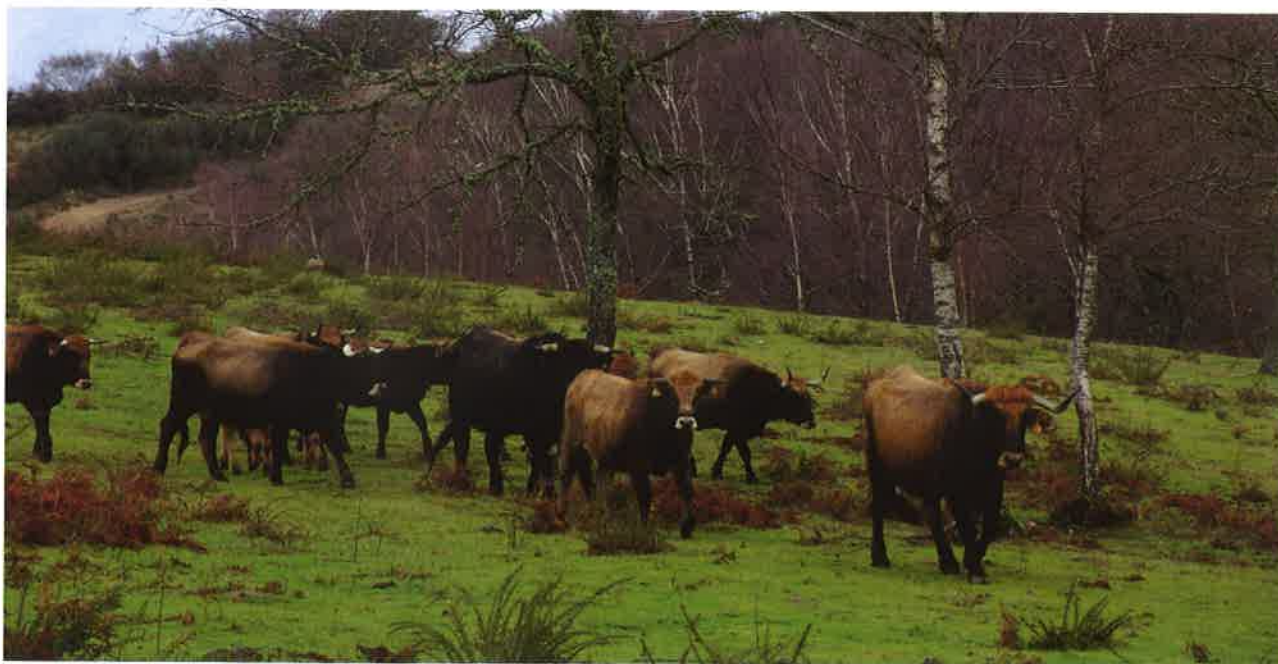
Rabaño de vacas de raza limiá.

aplicamos a tecnoloxía de medición por satélite, esa superficie non vale.