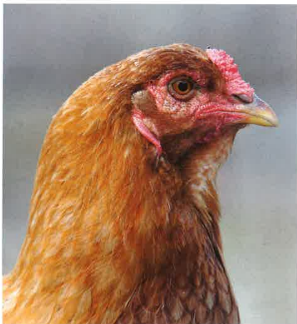
Galiña de Mos.

E por outra banda, os terreos queimados non se poden pastorear por gando, nin cazar, nos tres anos posteriores ao incendio. ¿Estamos tolos, ou alguén que ten gando queima para ter pastos que non pode pastar por lei? Se partimos da premisa de que despois dun delito hai que se preguntar quen se beneficia dese delito, os gandeiros creo que non, non poden pastorear co seu gando.